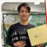
阪神タイガース 西 純矢 投手