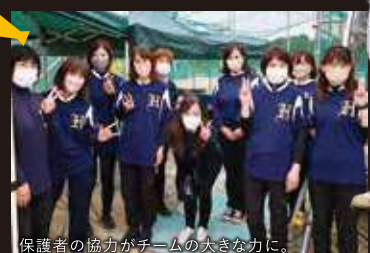
保護者の協力がチームの大きな力に。

監督やコーチよりも厳しく、そして温かい眼差しで選手たちを見守っているのが保護者の皆さんです。このサポートなくして、チームの勝利はありません。