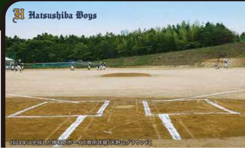
2021年に完成した堺初芝ボーイズ専用球場「天野山グラウンド」